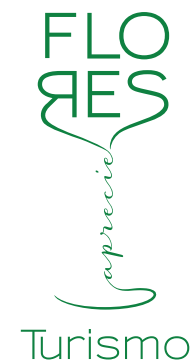
PROMOCIONAL TURISMO (Verde/Positivo)