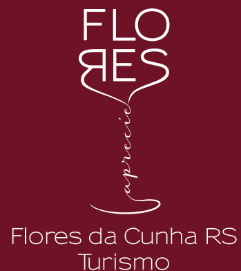
ASSINATURA INSTITUCIONAL REDUZIDA (Bordô/Negativo)