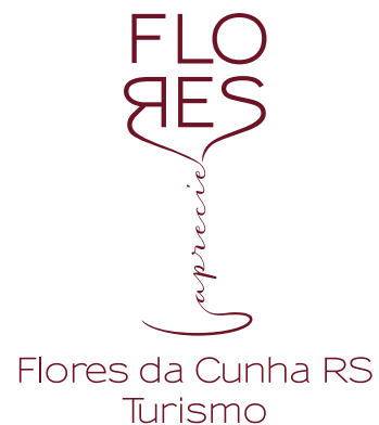
ASSINATURA INSTITUCIONAL REDUZIDA (Bordô/Positivo)