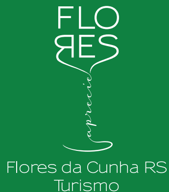
ASSINATURA INSTITUCIONAL REDUZIDA (Verde/Negativo)