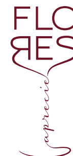
PROMOCIONAL REDUZIDA (Bordô/Positivo)