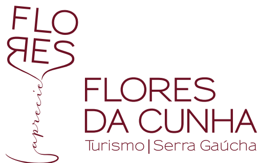
ASSINATURA INSTITUCIONAL (Bordô/Positivo)