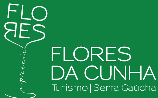
ASSINATURA INSTITUCIONAL (Verde/Negativo)