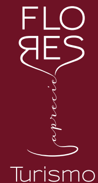
PROMOCIONAL TURISMO (Bordô/Negativo)