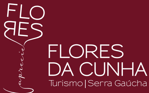
ASSINATURA INSTITUCIONAL (Bordô/Negativo)