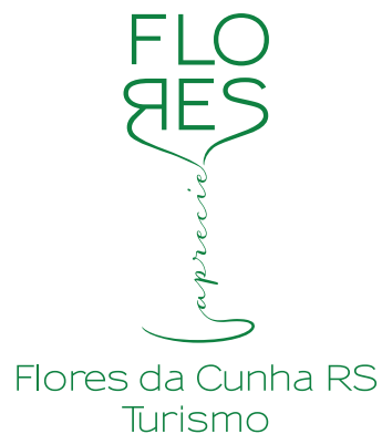
ASSINATURA INSTITUCIONAL REDUZIDA (Verde/Positivo)