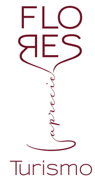
PROMOCIONAL TURISMO (Bordô/Positivo)