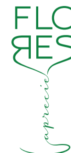
PROMOCIONAL REDUZIDA (Verde/Positivo)