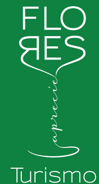
PROMOCIONAL TURISMO (Verde/Negativo)