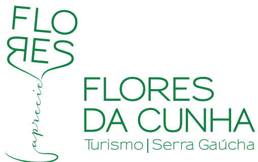
ASSINATURA INSTITUCIONAL (Verde/Positivo)